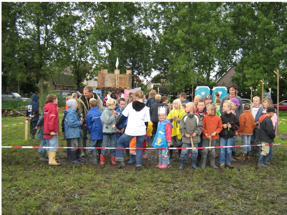
Er waren 90 kinderen gekomen die graag het terrein wouden bestormen.

Na de hele middag getimmerd te hebben werd er weer door de hofnarren van de jol een leuke dans ingestudeerd waardoor de kinders weer super enthousiast meededen en weer super vrolijk naar huis gingen.